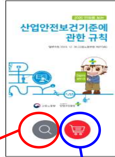
상품 자세히 보기로 이동